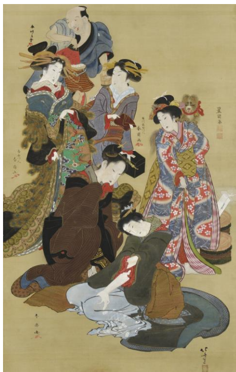
葛飾北斎、勝川春英、歌川豊国、勝川春扇、勝川春周、勝川春好 せいこう びじんほんじょうず 「青楼美人繁昌図」(前期)個人蔵 ※右は部分図

葛飾北斎が、勝川春好 しゅんこう 、勝川春英 しゅんえい など4名の勝川派絵師たち、そして歌川豊国とともに遊郭の女性たちと太鼓持ちを描いた作品です。