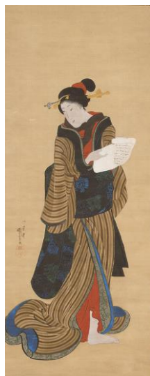
歌川国芳「文読美人図」(後期)摘水軒記念文化振興財団蔵、千葉市美術館寄託

▶右・葛飾北斎「登龍図」| 晩年の北斎は龍の肉筆画を多く残していますが、その中でも出色の作品です。龍の体には胡粉によるハイライトや墨の濃淡がほどこされ、今にも画面から飛び出すような立体感を生んでいます。