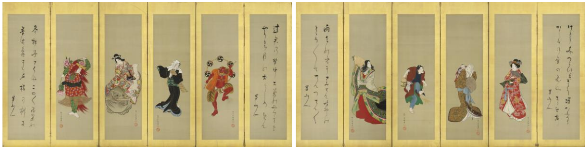
歌川豊国「三代目中村歌右衛門の九変化図屏風」(前期)個人蔵

三代目中村歌右衛門による「変化舞踊」の様子が八面に渡って描かれた屏風です。よくみると、右から3扇目は2種の舞踏が描かれており、合計9種の役を描いています。それぞれの特徴を鮮やかな彩色で描き分けながらも均整のとれた人物構図によって表現されており、豊国の肉筆画の技量を示す作品です。