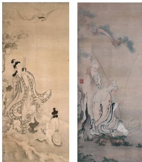
左 | 岩佐又兵衛「弄玉仙図」(旧 金谷屏風)【重要文化財】(前期) 摘水軒記念文化振興財団蔵、千葉市美術館寄託