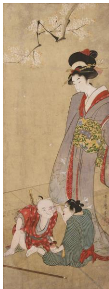
喜多川歌麿「隈取する童子と美人図」(後期)個人蔵

桜の枝の下、隈取りをする子どもたちと、その光景を微笑ましく眺める女性が描かれています。女性は享和期(1801-1804)の歌麿の特徴である瓜実顔の美人です。本作は長く行方不明でしたが、近年再発見された作品です。