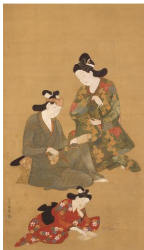
菱川師宣「二美人と若衆図」(前期)個人蔵、福井県立美術館寄託

▶岩佐又兵衛「弄玉仙図」、「龐居士図」| 福井の豪商・金屋家に伝わった「金谷屏風」は、 浮世絵の先駆・岩佐又兵衛 によって描かれた六曲一双の屏風でしたが、現在は掛軸となって分蔵されています。本展ではそのうち「弄玉仙図」「龐居士図」の二幅を前後期にわけて展示します。重要文化財・重要美術品の展示は、すみだ北斎美術館初の試みです。