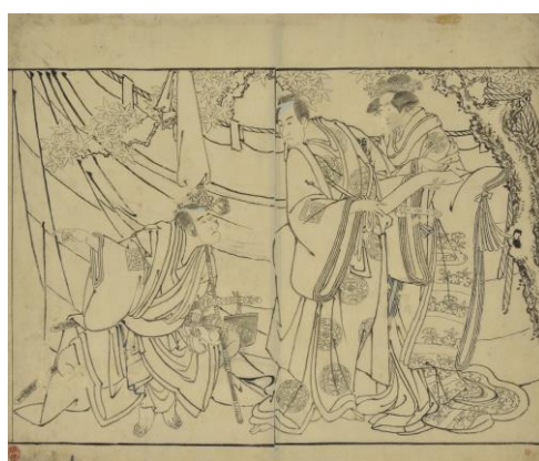
左 | 勝川春章「竹林七妍図」(後期)東京藝術大学蔵 中央 | 喜多川歌麿「夏姿美人図」(前期)遠山記念館蔵 右 | 東洲斎写楽「中山富三郎・市川男女蔵・市川高麗蔵図」 (後期)摘水軒記念文化振興財団蔵、千葉市美術館寄託

▶左・勝川春章「竹林七妍図」| 優れた肉筆美人画で知られる勝川春章(北斎の師)の晩年の代表作です。7人の女性が円を描くように配置され、髪型や服装によってそれぞれの身分や立場が描き分けられています。女性の髪の艶やかな質感は艶墨を重ねて表現されています。